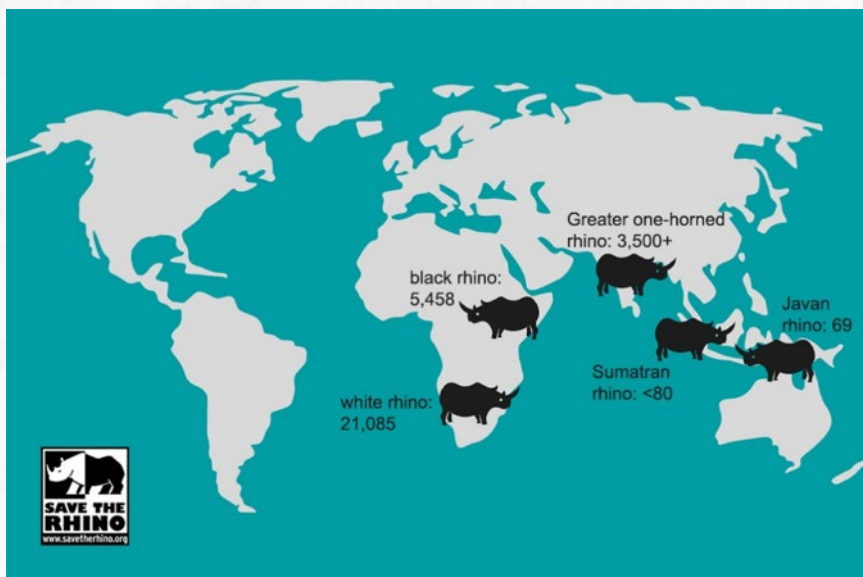
Neushoorn populaties in 2019